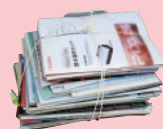
パンフレット・カタログ